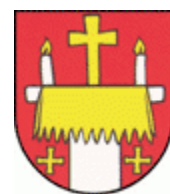
Zävadka nad Hronom